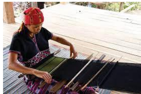
ภาพที่ 12 การทอผ้าชาวกะเหรี่ยง

(ม้ง) สตรีชนกลุ่มน้อยเผ่าม้งมีชื่อเสียงเกี่ยวกับฝีมือและเทคนิคการทอผ้าและตัดเย็บชุดพื้นเมืองที่สวยงาม และเป็นเอกลักษณ์ โดยศิลปะการทำลวดลายต่างๆบนชุดแต่งกายของชาวม้งจะใช้เทคนิคการวาดลายบนผ้าด้วย ขี้ผึ้ง ซึ่งเป็นภูมิปัญญาที่สืบทอดกันมาอย่างต่อเนื่อง “ผลิตภัณฑ์ต่างๆของชนกลุ่มน้อยเผ่าม้ง เช่น กระโปรง เข็ม ขัด ผ้าโพกหัว ส่วนใหญ่ใช้เทคนิคการเย็บปักถักร้อย การตกแต่งผ่านการจับคู่ผ้า การวาดลายด้วยขี้ผึ้ง ซึ่งมักจะใช้ รูปตัวอักษร “เถิบ” และ “ดิง” ในภาษาฮั่น พร้อมกับรูปทรงขนมเปียกปูนหรือรูปสามเหลี่ยม ผลิตภัณฑ์ของชนกลุ่ม น้อยเผ่าม้งมีลวดลายหลายแบบ ซึ่งสะท้อนคุณค่า ความคล่องตัวและความแตกต่างของสตรีชนกลุ่มน้อยเผ่าม้งกับ ชนเผ่าอื่นๆ”