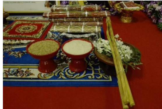
ภาพที่ 7 อุปกรรมในพิธีกรรม