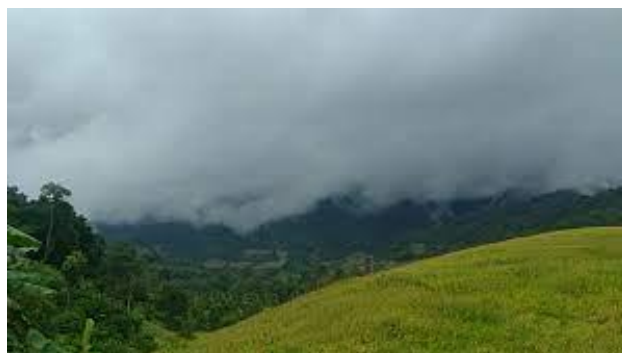
ภาพที่ 14 บรรยากาศหุบชะนี

หุบชะนีจะตั้งอยู่บนยอดดอยของหมู่บ้านโล๊ะโคะ จะมีภูเขารอบ ๆ มีธรรมชาติรอบ ๆ 360 องศา กลางคืน อากาศค่อนข้างเย็น และมีลมแรง ในตอนกลางคืน และในตอนเช้าจะได้สัมผัสกับบรรยากาศที่เย็นสบาย ถ้าไป ในช่วงปลายฝนต้นหนาวหรือ ในช่วงที่อากาศเย็นมาก ๆ ก็มีโอกาสดูเห็นทะเลหมอก