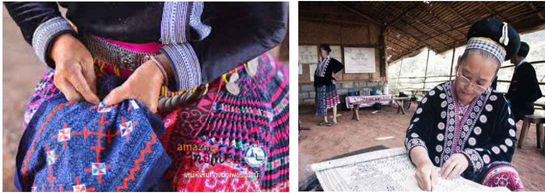
ภาพที่ 12 การทอผ้าชาวม้ง