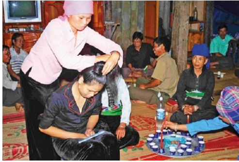
ภาพที่ 4 ตีหมั้นหัวเกล้า “เอะฮะซิโซ”

เพื่ออธิษฐานและขอพรให้การเดินทางอย่างราบรื่น เมื่อเสร็จพิธีแล้วทั้งคณะก็ออกเดินทางโดยพร้อมเพรียงกันที่จุดนัดหมาย พอถึงบ้านเจ้าสาวแล้วจะมีเจ้าแม่ฝ่ายเจ้าสาวและชาวบ้านที่มาคอยต้อนรับที่จุดนัดหมายที่เตรียมไว้ล่วงหน้า เพื่อทำพิธีตีหมั้นหัวเกล้า “เอะฮะซิโซ” หลังจากเสร็จพิธีแล้ว ตัวเจ้าบ่าวและญาติพี่น้องจะขึ้นไปบนบ้านเจ้าสาว เพื่อการเลี้ยงสังสรรค์แสดงความยินดีกันทั้งสองฝ่าย แสดงถึงความรักและความสามัคคี