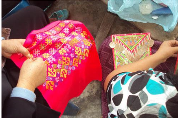
ภาพที่ 13 การปักลูกเดือยบนผ้าขาม้ง

ดั้งเดิมที่เป็นเอกลักษณ์เฉพาะที่สืบทอดกันมาตั้งแต่สมัยบรรพบุรุษ ลวดลายที่ถูกสร้างสรรค์จากจินตนาการ เลียนแบบมาจากธรรมชาติสิ่งแวดล้อมรอบตัว วิถีชีวิต