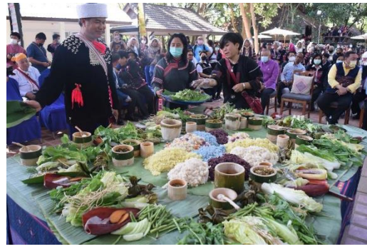
ภาพที่ 11 ประเพณีกินข้าวใหม่ของม้ง