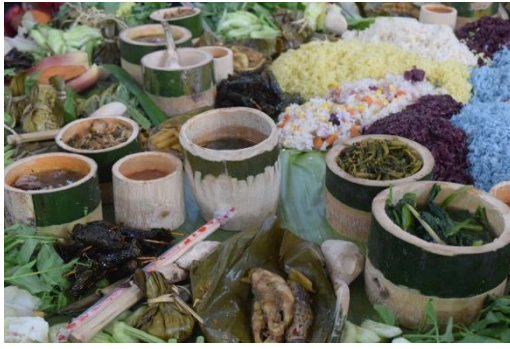
ภาพที่ 10 เครื่องเซ่นไหว้