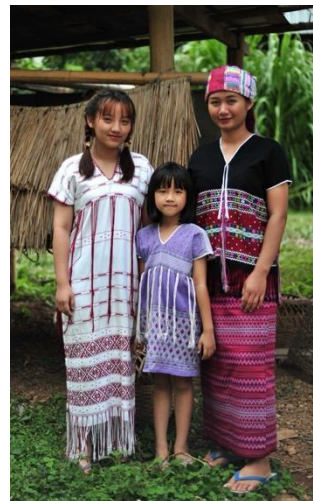
ภาพที่ 16 การแต่งกายชาวกะเหรี่ยง