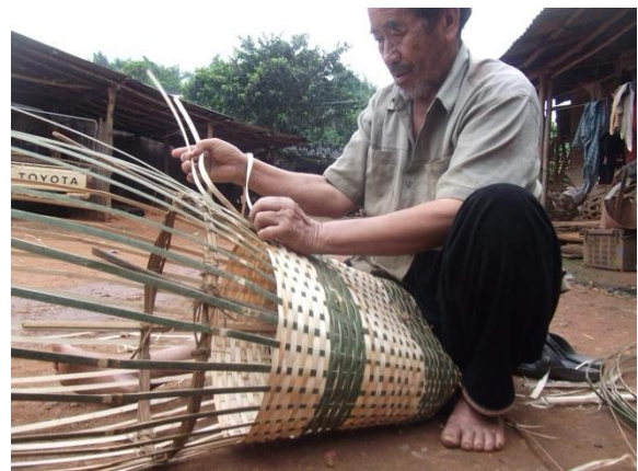
ภาพที่ 13 การสานเครื่องมือใช้สอยในชีวิตประจำวันชาวกะเหรี่ยง

(จักสารของม้ง) อุปกรณ์ เครื่องใช้ของม้งโดยปกติแล้วม้งจะมีความทำงานหนักในไร่หรือในสวนต่างๆ ม้งจึง มีการตีมิติให้เหมาะสมกับงานที่ทำเช่น การตัดไม้จะต้องใช้ มิติด้ามยาว (เม้าะจ๊วะ) หรืออาจจะใช้ขวานก็ได้ ส่วน การทำอาหารต่างจะใช้มิติด้ามสั้นหรือมิติปลายแหลม ส่วนงานที่หนักจะต้องใช้มิติที่มีขนาดใหญ่ เหมาะกับการใช้