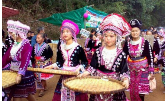
ภาพที่ 9 พิธีกรรมปีใหม่ของชาวม้ง

ทุกวันนี้แม้งานปีใหม่ม้งจะจัดตามช่วงเวลาสงท้ายปีตามจันทรคติ หรือจะตกราวเดือนพฤศจิกายนถึงเดือนมกราคม แต่ความหลากหลายของผู้คน ลักษณะการแต่งกาย การจัดงานและหน่วยงานในระดับท้องถิ่นมีบทบาทอย่างเป็นทางการมากขึ้น ในทางหนึ่งส่งผลต่อการเปลี่ยนแปลงที่สนองการท่องเที่ยว แต่ขณะเดียวกันอาจเป็นโอกาสอันดีให้เกิดการสื่อสารข้ามวัฒนธรรมผ่านงานรื่นเริงและการละเล่น สุดท้ายสิ่งที่คงอยู่ในงานเทศกาลปีใหม่นี้ ยามที่งานเฉลิมฉลองสิ้นสุด ทุกคนต่างกลับไปดำเนินชีวิตตามปกติ พร้อมกับโชคสามและสิ่งดี ๆ ที่มาพร้อมกับปีใหม่