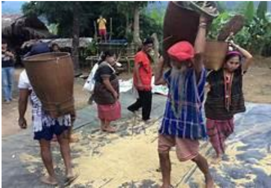
ภาพที่ 6 พิธีกรรมข้าวใหม่กะเหรี่ยง