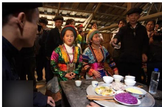
ภาพที่ 8 พิธีแต่งงานของชาวม้ง