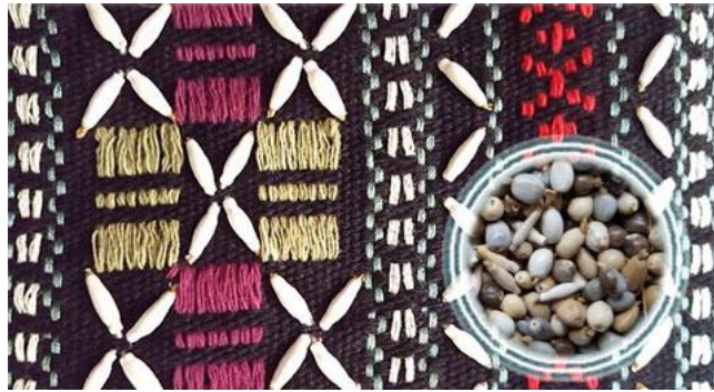
ภาพที่ 13 การปักลูกเต๋อยบนผ้ากะเหรี่ยง

การปักผ้าด้วยลูกเต๋อย ซึ่งเป็นเมล็ดที่ได้จากต้นเต๋อยที่ชาวกะเหรี่ยงมักปลูกไว้ในไร่นา ผู้หญิงชาวกะเหรี่ยงจะนำลูกเต๋อยเหล่านี้มาแกะแยกออกเป็นเม็ดๆ แล้วนำมาเป็นวัสดุในการปักตกแต่งผ้าทอเป็นลวดลายต่างๆ เพิ่มความสวยงาม ส่วนใหญ่มักนิยมปักในเสื้อผู้หญิงที่แต่งงานแล้ว ผ้าสไบต่างๆ ทั้งผ้าคลุมไหล่ ผ้าคลุมศีรษะ ตลอดจนไปจนถึงการนำไปปักตกแต่งขอบคอเสื้อ ขอบแขนเสื้อ กระเป๋าย่ามต่างๆ เป็นต้น