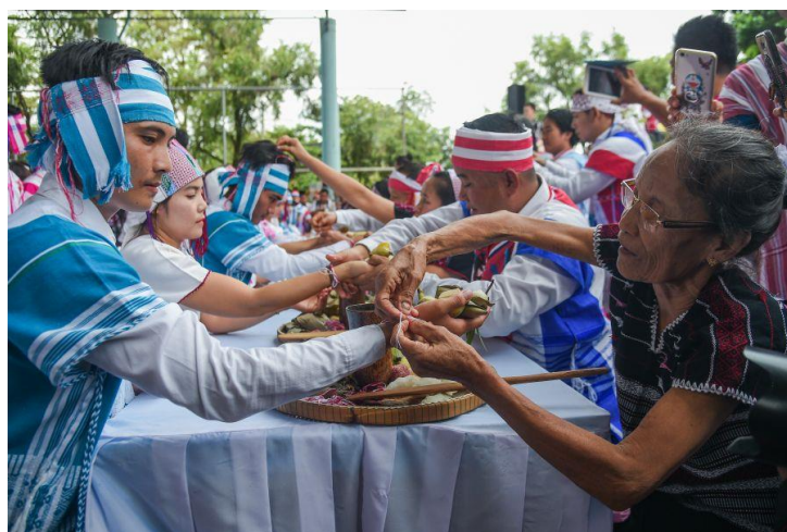
ภาพที่ 5 การผูกข้อมือเรียกขวัญ

ทั้งนี้ สืบเนื่องจากชาวกระเหรี่ยงมีความเชื่อว่าทุกชีวิตมี "ขวัญ" เป็นส่วนประกอบสำคัญทางจิตวิญญาณ แต่การที่ต้องออกจากบ้านไปไกลเพื่อทำงาน หรือการเข้าป่าทำไร่ หาของป่า การต้องพบเจอเหตุการณ์ที่อาจทำให้ตกใจ อาจเป็นสาเหตุที่ทำให้ขวัญที่มินั้นหายไป เมื่อถึงเวลาในเดือน 9 จึงต้องมีการทำพิธีเพื่อเรียกขวัญให้กลับคืนมา เพื่อให้ขวัญได้กลับคืนมาอยู่กับเจ้าของ ซึ่งจะส่งผลให้เรามีสุขภาพแข็งแรง ปราศจากโรคร้ายไข้เจ็บ มีความสุข ความเจริญในทุกๆ ด้าน แต่เดิมพิธีผูกข้อมือเรียกขวัญจะทำการกันในครอบครัว หรือในหมู่เครือญาติ แต่ด้วยสภาพสังคมและวิถีชีวิตในปัจจุบันที่หลายคนต้องจากบ้าน บางครั้งจึงไม่สามารถเดินทางกลับไปร่วมพิธีกับครอบครัวที่บ้านได้ จึงได้มีการริเริ่มจัดพิธีผูกข้อมือเรียกขวัญที่วัด เพื่อใช้เป็นศูนย์กลางอำนวยความสะดวกกับประชาชนบางกลุ่ม การจัดพิธีที่วัด มีข้อดีที่ทำให้ประชาชนได้มีโอกาสพบปะกันในหมู่เพื่อนฝูง เพื่อนบ้าน และญาติพี่น้อง ทำให้เกิดความรักความสามัคคี และเกิดความสัมพันธ์ที่ดีต่อกัน