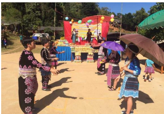
ภาพที่ 1 การละเล่นข่าง ลูกช่วง

ที่หมู่บ้านของชาวม้งประเพณีปีใหม่ของพวกเขาดตรงกับ วัน ขึ้น 1 ค่ำ เดือน 1 ของม้ง ซึ่งตรงกับปฏิทินไทยคือ ขึ้น 1 ค่ำ เดือน 2 หรือ ปฏิทินจีน คือ ขึ้น 1 ค่ำ เดือน 12 ซึ่งส่วนใหญ่จะอยู่ในระยะเวลาระหว่างเดือนธันวาคม-มกราคมของทุกปี ซึ่งในวันปีใหม่นี้ของชาวม้งจัดเป็นงานประเพณีที่ชาวม้งรอคอยอย่างใจจดใจจ่อ เนื่องจากจะเป็นการพบปะกันระหว่างกลุ่มญาติมีประเพณีขอพรจากสิ่งศักดิ์สิทธิ์และผู้อาวุโส เป็นวันที่หนุ่มๆสาวๆในหมู่บ้านจะได้เลือกคู่ มีการจัดการแข่งขันกีฬาประเพณีและการละเล่นต่างๆ เช่น ลูกข่าง ลูกช่วง และยังมีการแข่งขันล้อเลื่อนไม้ชิงแชมป์ประเทศไทยซึ่งเป็นกีฬาที่ทำทายน่าสนใจเป็นอย่างมาก แต่นอกการละเล่นที่สร้างความสนุกสนานแล้วชาวม้งก็ไม่ลืมที่จะทำพิธีกรรมต้อนรับปีใหม่ที่จัดเป็นพิธีกรรมที่ชาวม้งให้ความสำคัญกันมาก