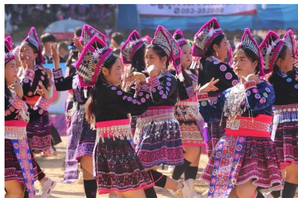
ภาพที่ 2 การเต้นรำชนเผ่า