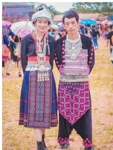
ภาพที่ 15 การแต่งกายชาวม้ง

ในปัจจุบัน การแต่งกายของชาวม้งเริ่มมีการเปลี่ยนแปลงไปบ้าง โดยเฉพาะกลุ่มม้งรุ่นใหม่ นิยมแต่งกายแบบสมัยนิยมมากขึ้น แต่ยังคงมีเอกลักษณ์ของชาวม้ง