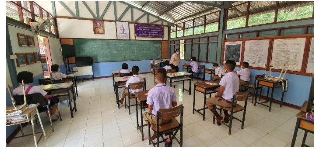
...กิจกรรมสำรวจปัญหาและความต้องการโรงเรียนตำรวจตระเวนชายแดนบ้านตีนดอย ตำบลแม่หละ อำเภอสองยาง จังหวัดตาก ระหว่างวันที่ 15-17 กรกฎาคม 2563