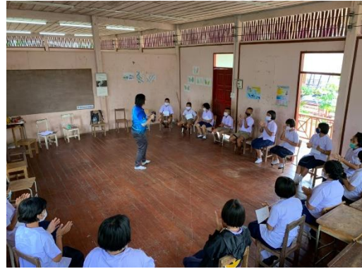
...กิจกรรมสำรวจปัญหาและความต้องการโรงเรียนตำรวจตระเวนชายแดน จุฬา-ธรรมศาสตร์ 3 ตำบลแม่ระมาด อำเภอท่าสองยาง จ.ตาก ระหว่างวันที่ 15-17 กรกฎาคม 2563