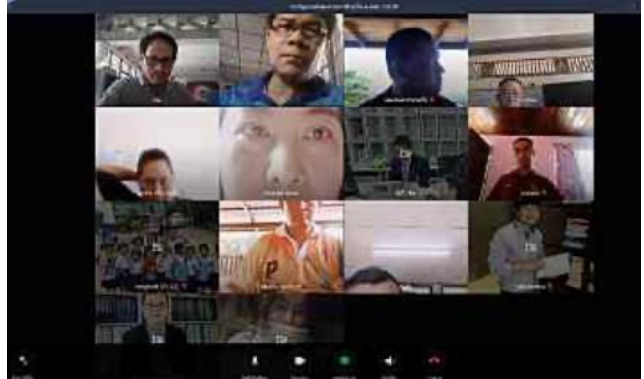
...ประชุมออนไลน์ระบบ Line ภาศิเครือข่ายประกอบด้วย ครูใหญ่ รร.ตชด. โค้ช และทีมลงพื้นที่ เพื่อทำความเข้าใจกิจกรรม การเตรียมการต่างสำหรับกิจกรรมการลงพื้นที่ วันที่ 4 กรกฎาคม 2563