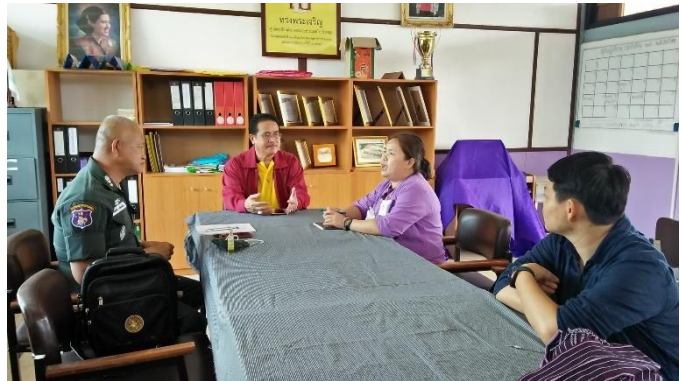
...กิจกรรมสำรวจปัญหาและความต้องการโรงเรียนตำรวจตระเวนชายแดนบ้านห้วยสูง ตำบลพระธาตุ อำเภอแม่ระมาด จังหวัดตาก ระหว่างวันที่ 13-15 กรกฎาคม 2563