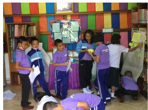
...กิจกรรมสำรวจปัญหาและความต้องการโรงเรียนตำรวจตระเวนชายแดนเฉลิมพระเกียรติ 7 รอบ (บ้านแพะ) ตำบลแม่ตื่น อำเภอแม่ระมาด จังหวัดตาก ระหว่างวันที่ 15-17 กรกฎาคม 2563