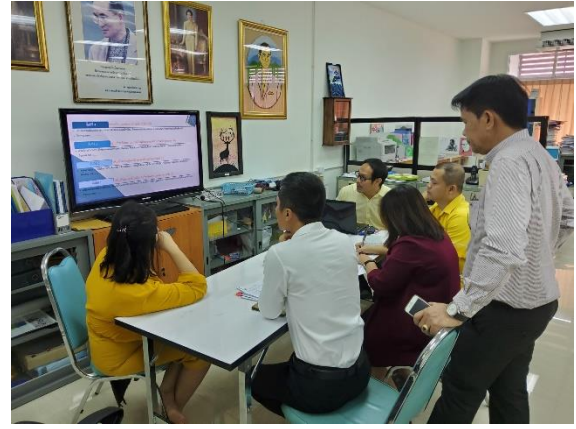
การประชุมศึกษาความต้องการระบบโดยอาจารย์ประจำสาขา 20 ม.ค. 2564