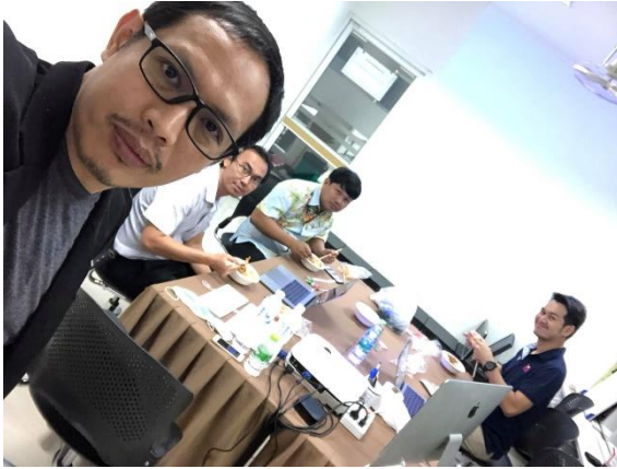
การประชุมวิเคราะห์ระบบโดยผู้เชี่ยวชาญ 6 ม.ค. 2564